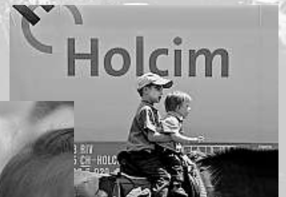
Mit dem Pferd auf Werksrundgang

Wollen Sie mehr über das Zementwerk Untervaz erfahren? Das Jubiläumsschrift ist als PDF unter www.holcim.ch abgelegt.