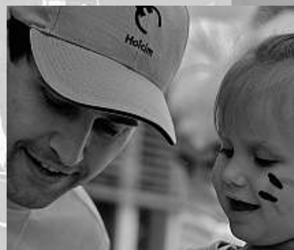
Das Zementwerk Untervaz: Ein Erlebnis für die ganze Familie

Über 4000 Gäste besuchten das Zementwerk Untervaz