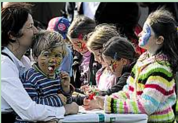
Die Kleinsten können sich vom Grüsch-Danusa-Team schminken lassen (links) und der Danusafuchs verteilt Süßigkeiten.