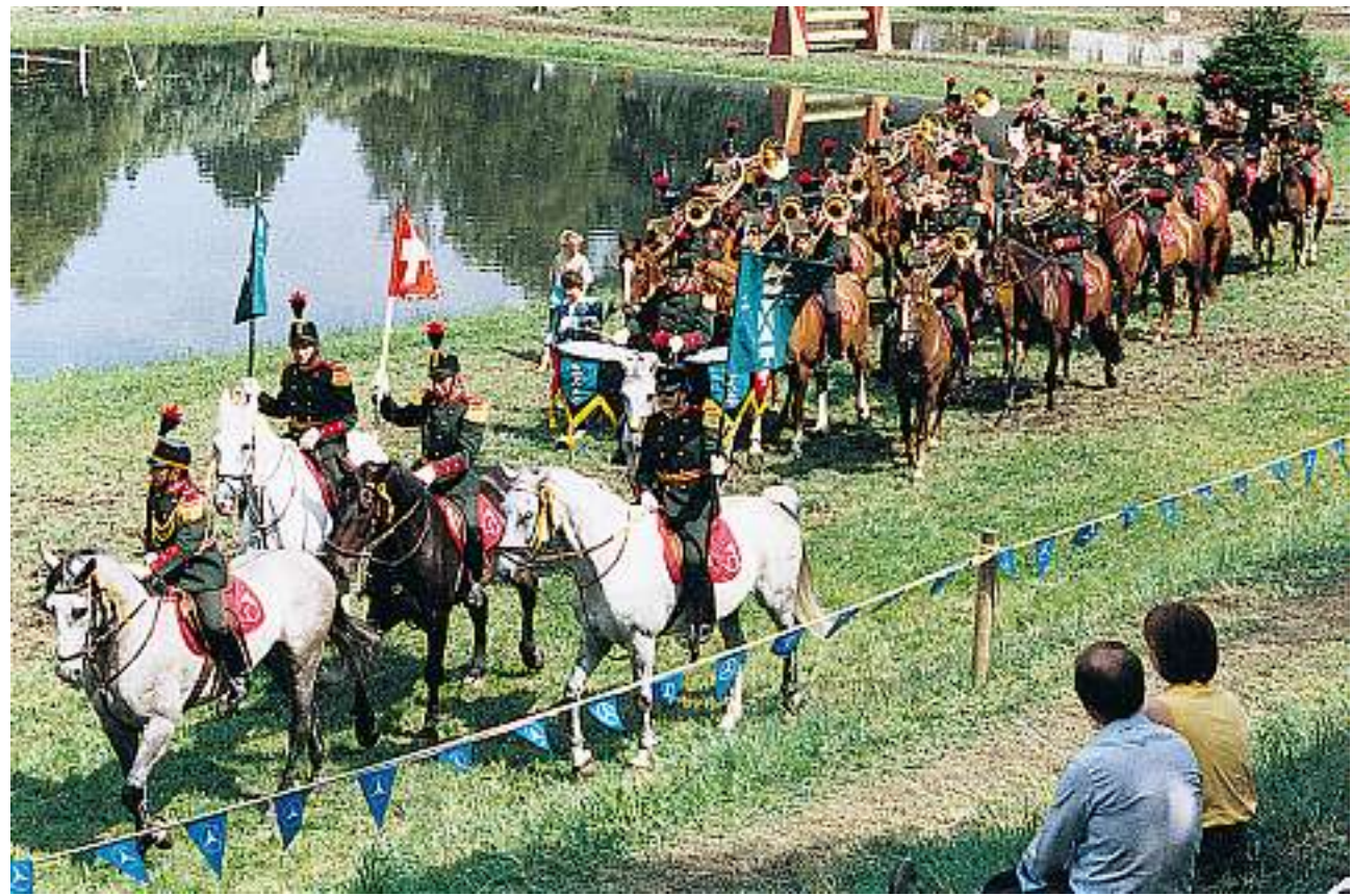
Die St. Gallische Reitermusik wird am ersten Rennsonntag vor der grossen Tribüne aufspielen.

Der Ursprung von berittener Musik geht sehr weit zurück. In früheren Zeiten hatte sie zur Aufgabe, berittene Truppen zu begleiten und Befehle mittels Musiksignalen zu übermitteln. Gleichzeitig sollte mit der Musik die Moral und Einsatzbereitschaft der Wehrmänner gefördert werden. Um 1950 wurde sie in den meisten Armeen aufgehoben. Während die Reitermusik bis anhin, mit Ausnahme von einigen berittenen Jägermusikern, immer eine Militärmusik war, wird sie seither allein durch Liebhaber weitergepflegt. In der Schweiz gibt es nach