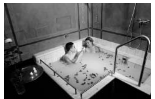
Dritter Preis: ein alpines Reinigungszeremoniell im Spahouse Bad Ragaz für zwei Personen.