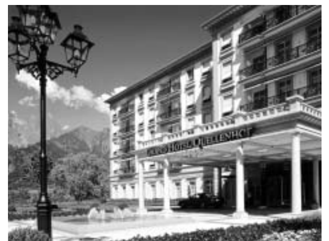
Zweiter Preis: eine Übernachtung für zwei Personen in einer Junior Suite im «Grand Hotel Quellenhof in Bad Ragaz».