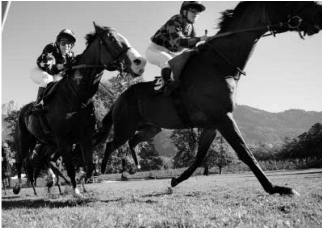
Spannung garantiert: Die Pferderennen in Maienfeld versprechen Pferdesport auf höchstem Niveau.