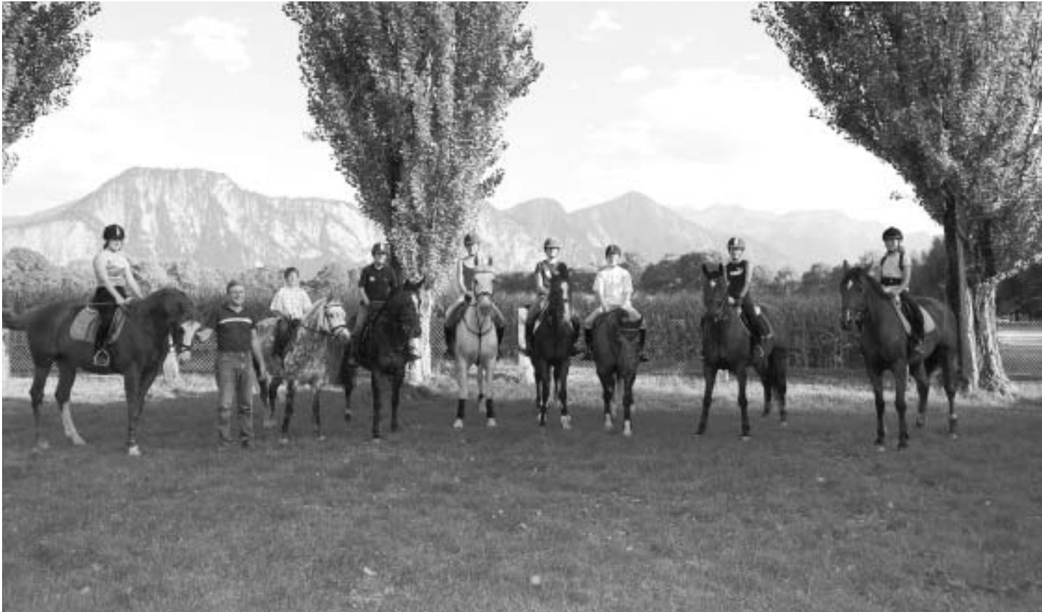
Hoch zu Ross: Mitglieder des Jugendreitvereins zusammen mit ihrem Trainer, Alfons Zindel.

zentrums Falknis kostenlos benutzen zu dürfen. Zudem seien viele der Jugendlichen auf den Goodwill der Reiter angewiesen, indem sie im Training deren Pferde reiten dürften. Am Festakt zum 50-Jahr-Jubiläum des Rennvereins werden die Jugendlichen dem Publikum Dressurfiguren und Rennsprünge zeigen. Die Jüngsten werden im Föhrring Pferde führen.