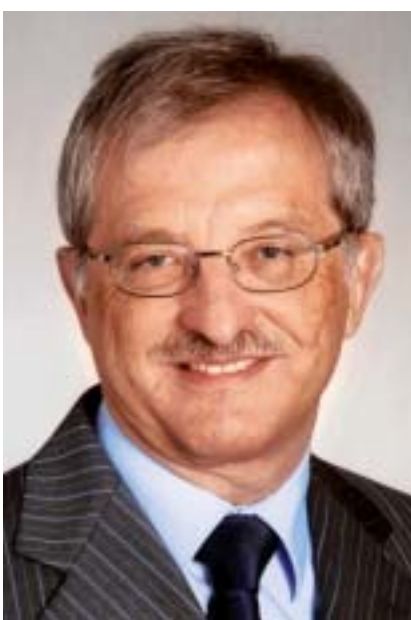
Regierungsrat Hansjörg Trchsel, Vorsteher des Departements des Innern und der Volkswirtschaft Graubünden.